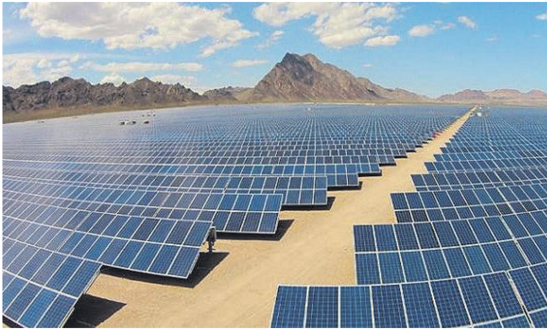
Els parcs solars, habituals en moltes extensions de la "meseta" espanyola, podrien ser una realitat també a l'Anoia.

Un cop la ponència fa aquest pronunciament favorable, considerar un parc "viable",