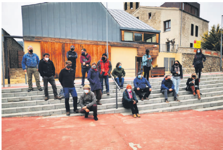
A Copons i Rubió ja s'han constituït en plataforma veïnal contra el que consideren és la destrucció del paisatge.

També critica que no es tinguin en compte els ajuntaments a l'hora de planificar i ho considera un "despropòsit", ja que, segons ell, els parcs s'han planificat en zones que "destrossen el paisatge". I és que a Rubió no només tindrien impacte els parcs de La Maçana i Serra Morena, sinó que el municipi també es veuria afectat pels dos parcs projectats al Bages, el de Clarena i