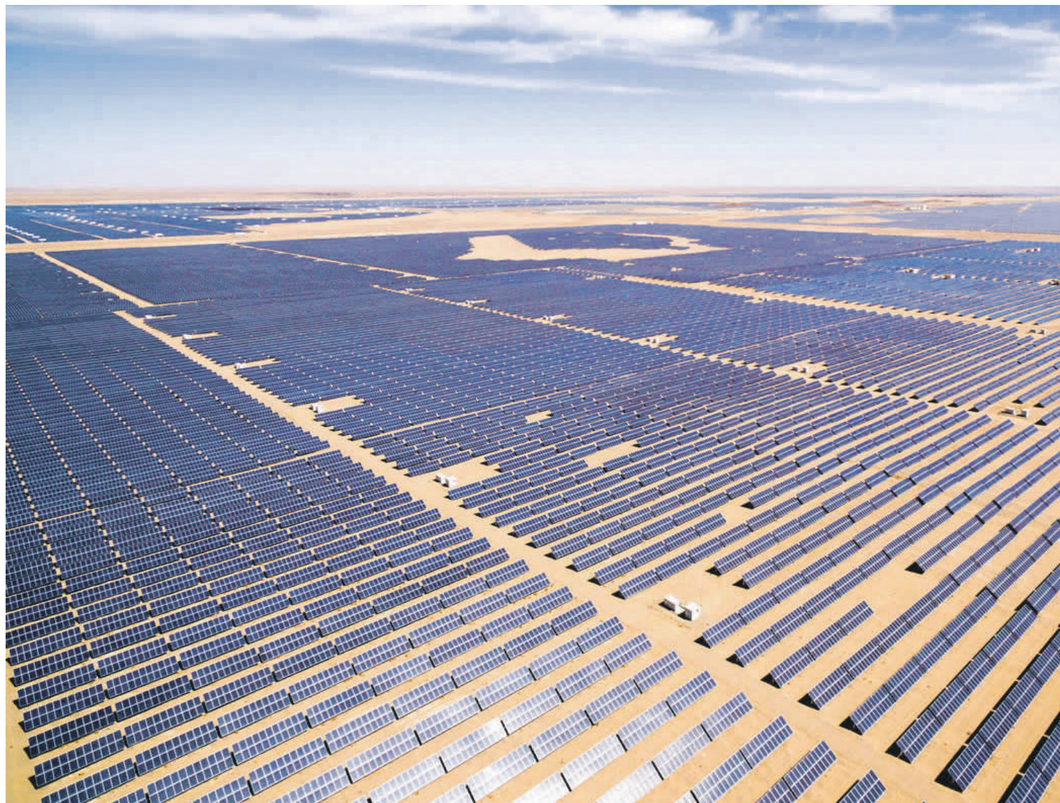
Parcs fotovoltaics com aquest, habituals en certes parts del centre i oest d'Espanya, poden formar part aviat del paisatge de l'Anoia.